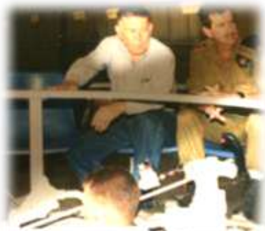
ביקור סגן שר הביטחון ישראל טל "טליק" ז"ל בסימולטור צריח בבה"ד

יעקב מונה לתפקיד מפקד בה"ד 20 בינואר 1988 שוב מכיוון שקודמו בתפקיד אל"מ יוסי אוחיון החליט לפתע לפרוש וסוכם שיעקב יחליפו בלו"ז קצר.