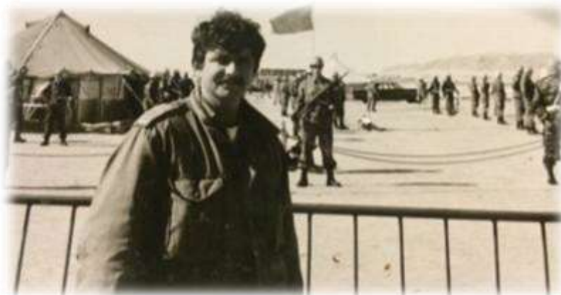
מגדוד לחטיבה באותה הדרגה

תמונה זו פורסמה בידיעות אחרונות במהלך המלחמה