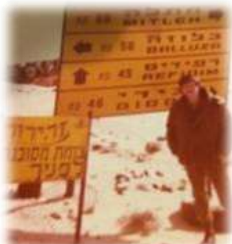
שלט דרכים בסיני עם שמות מחנות צה"ל לפני המלחמה

ת: "בתקופה ההיא היה יותר ניסיון מעצם השגרה, לאורך התעלה טנקים נגמ"שים ורכבי הגדוד נסעו הרבה מאות קילומטרים בשבוע, מה שבאופן טבעי יצר תקלות רבות ובעצם כך רכשו אנשי החימוש את ניסיונם, מה גם שאז, היו הרבה יותר בוגרי בתי ספר מקצועיים. גם אנשי המילואים של הגש"חים היו מיומנים. הגש"חים היו מורכבים בחלקם מגרעין סדיר